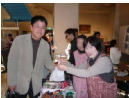
作業所の手作り商品を買う物