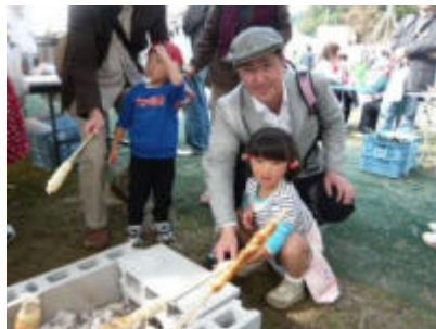
娘と野外でパン焼き